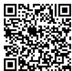
青少年專題研習指引 Teens' Project Guide