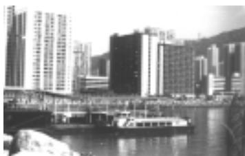
1982 年舊屯門碼頭，友愛邨及安定邨 Old Tuen Mun Pier, Yau Oi Estate and On Ting Estate 1982