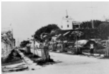
1908 年 尖沙咀廣東道 Canton Road Tsim Sha Tsui 1908