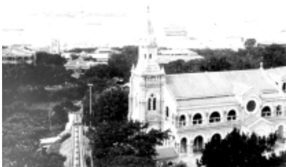
1900 年堅尼地道佑寧堂 Union Church, Kennedy Road 1900