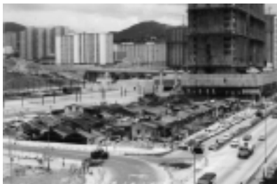
1980年代荃灣木棉下村 Tsuen Wan Muk Min Ha Tsuen in 1980's

此書簡介香港史，由新石器時代開始至1984年中英政府簽署聯合聲明作結。全書分為三部分：黎明時期，開埠時期及發展時期。書中圖文並茂地介紹香港不同時期的發展，民生習俗及社會面貌，有助讀者認識本地歷史轉變。