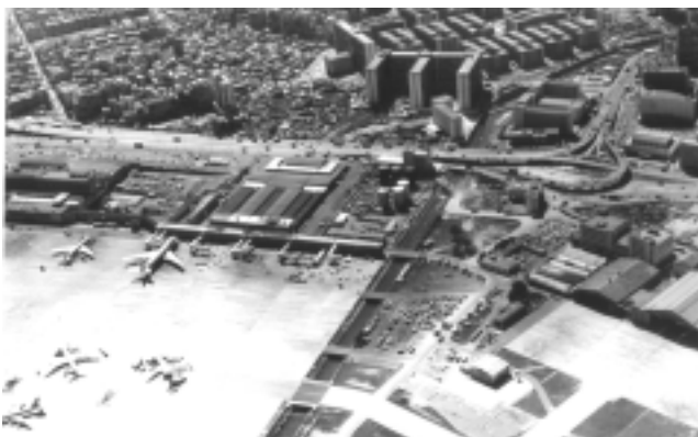
1972 年啟德機場及新蒲崗 Kai Tak Airport and San Po Kong 1972