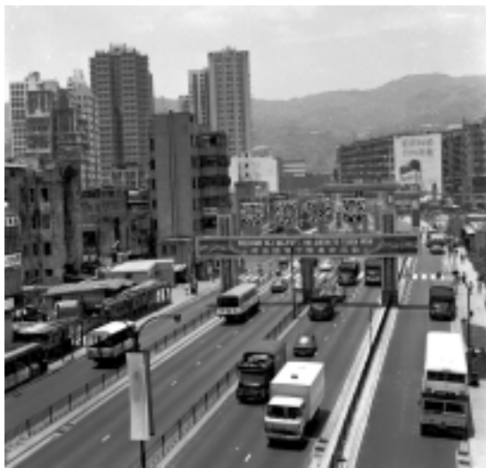
1975 年青山公路 -