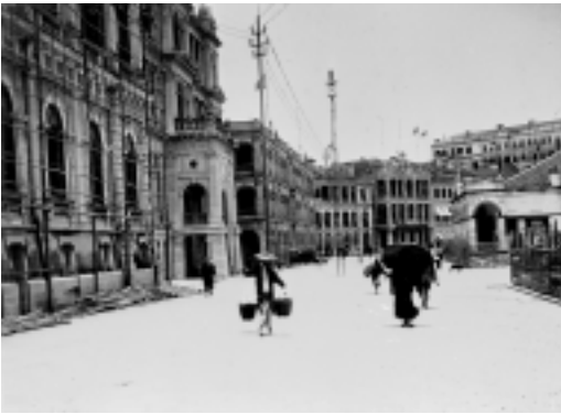
1890 年中環舊大會堂(左)・其右為香港上海滙豐銀行 Old City Hall (left), Hong Kong & Shanghai Bank on its right 1890

Old Hong Kong III spans what is probably the most dramatic half-century in Hong Kong's turbulent history. It opens as the postwar colony faces the challenge of reinventing itself as a centre of industry, then the birth of Hong Kong's 'economic miracle' and the end of the colonial era.