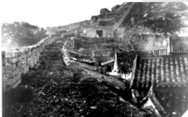
1930 年九龍寨城及延伸往白鶴山的城牆 Kowloon Walled City with the extension wall running up the hill 1930