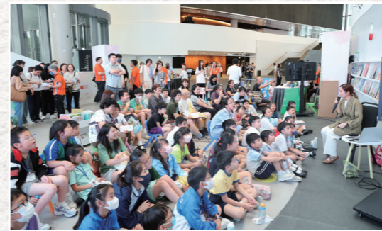
兒童繪本作家艾美仔以「接受不完美的自己」為題與讀者分享。