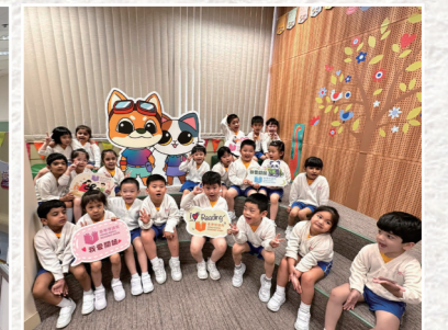
各區公共圖書館也舉辦不同形式的閱讀活動，響應「共讀半小時」。