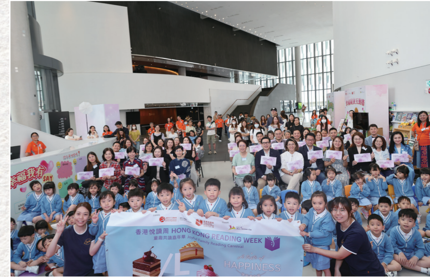
香港公共圖書館與安徒生會合辦「童趣共讀嘉年華」。

「幸福哈哈鏡」以安徒生童話《樅樹》為靈感，鼓勵大家在當下開懷歡笑，珍惜並記住眼前的幸福時光。