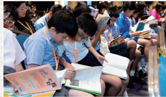
現場逾百間學校師生參與，場面熱鬧。

教育局在啟德體育園舉辦「閱讀無界限分享會暨中小學聯校共讀半小時」活動，線上線下逾三萬名師生參與。