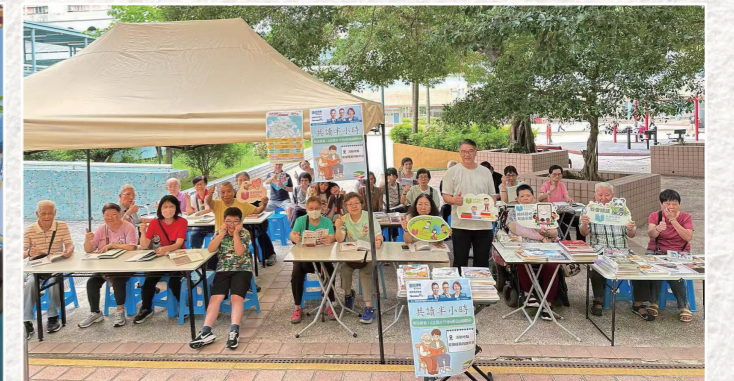
黎榮浩議員於橫頭磡邨與居民一起閱讀。