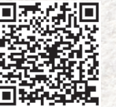
《幸福索引—書與旋律之間》

夜幕低垂，香港中央圖書館展覽館傳來動人歌聲，歌手林奕匡主持音樂故事分享會，以歌曲和精選書本篇章，細說文字如何陪伴他走過人生起伏。完整分享會現已上載至香港公共圖書館 YouTube 頻道，歡迎重溫。