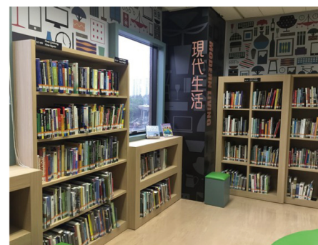
設於荃灣公共圖書館的「現代生活」特藏提供有關家居及綠色生活的資訊。 Modern Living Collection in Tsuen Wan Public Library provides information on modern home and green living.

香港公共圖書館特藏知多點 Know more about HKPL's special collections