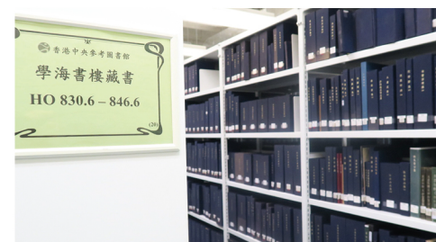
存放於香港中央圖書館的學海書樓特藏。 The Hok Hoi Collection housed in the Hong Kong Central Library.

The Central Reference Library of the HKCL is also the depository library for a number of international organisations, including the United Nations, World Bank and World Trade Organisation, giving readers a window to global information.