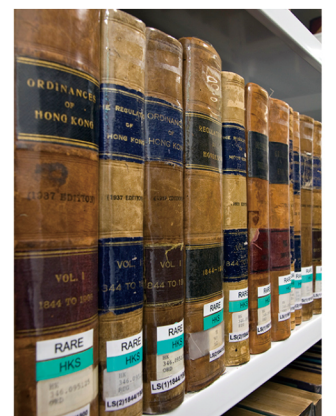
香港資料特藏內容廣泛，提供有關香港今昔資料。 The Hong Kong Collection is a comprehensive collection, providing current and retrospective information on Hong Kong.