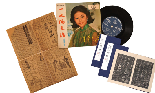
文獻徵集特藏提供有關中國或香港的歷史文獻資料。 The Documents Collection Campaign Collection provides heritage documents of China or Hong Kong.